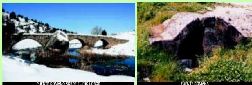
PUENTE ROMANO SOBRE EL RÍO LOBOS

El municipio de Hontoria del Pinar cuenta con notables atractivos turísticos tanto en el paisaje como en los testimonios artísticos de su historia pasada. El municipio está formado a su vez por Aldea y Navas del Pinar. El entorno de estos tres barrios cuenta con panoramas bellos y llenos de