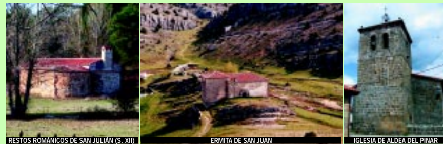
RESTOS ROMANICOS DE SAN JULIAN (S. XII)