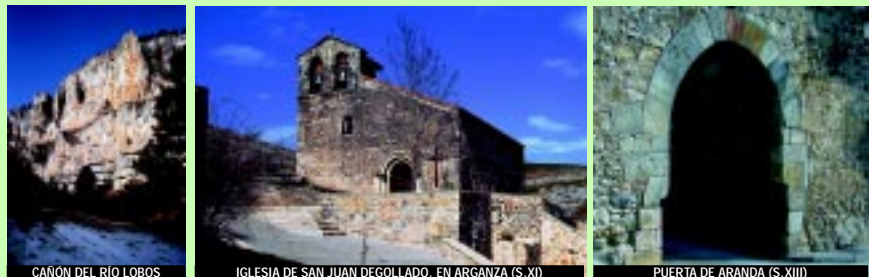
CAÑÓN DEL RÍO LOBOS