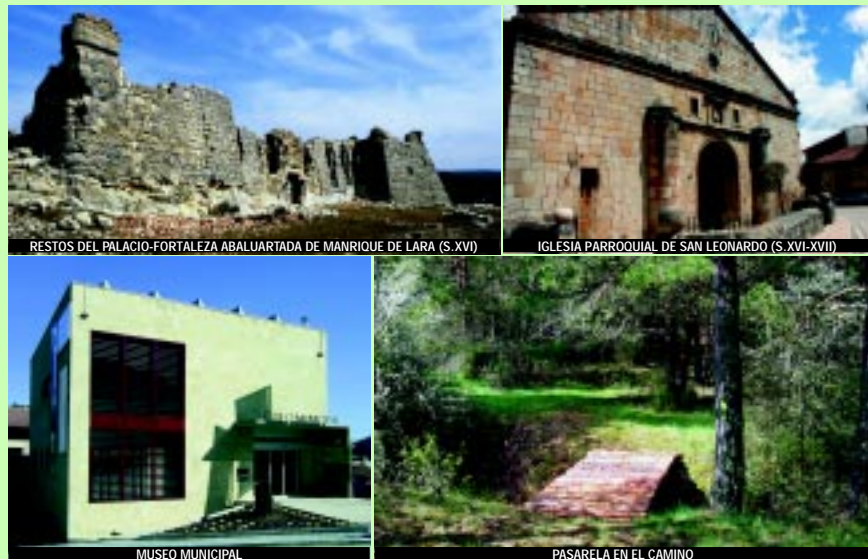
RESTOS DEL PALACIO-FORTALEZA ABALUARTADA DE MANRIQUE DE LARA (S. XVI)